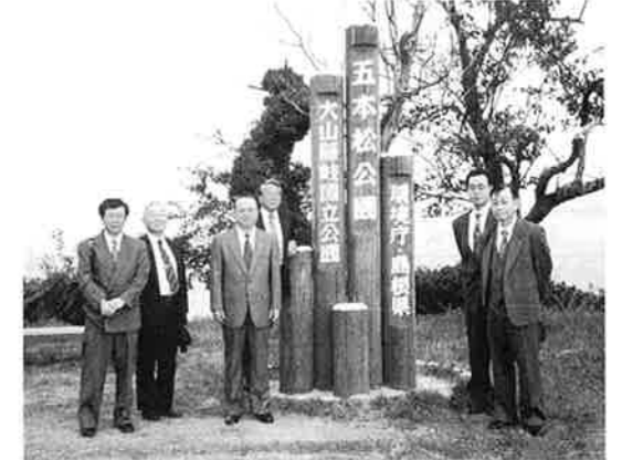
95.10.7 鳥取県支部総会 於 三保五本松