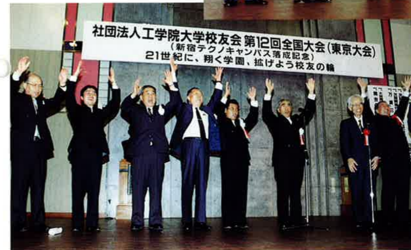
理事長の音頭による学園・校友会役員の万歳三唱