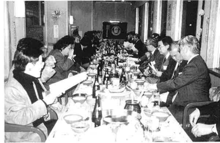
97.1.24 福岡県支部総会 於 福岡市ワシントンホテル