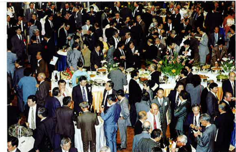
大盛況の懇親会場内風景