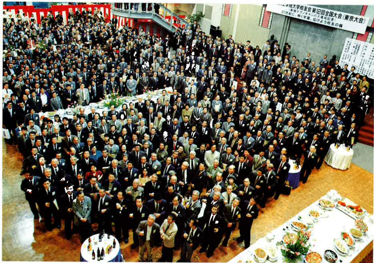
さあ～あなたは写真の何処にいらっしゃいますか！