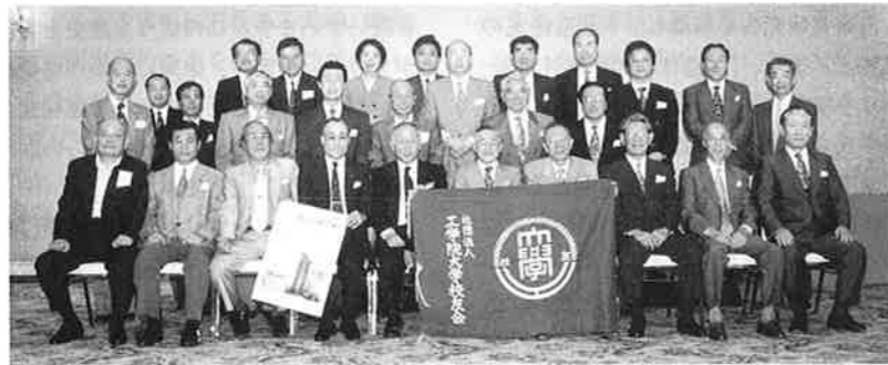
96.6.23 埼玉県西支部総会 於 東松山市紫雲閣