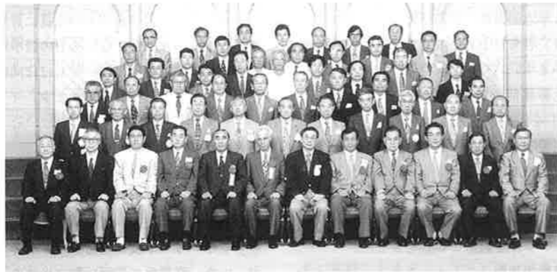
96.7.7 千葉県支部総会 於 ちば玉姫殿