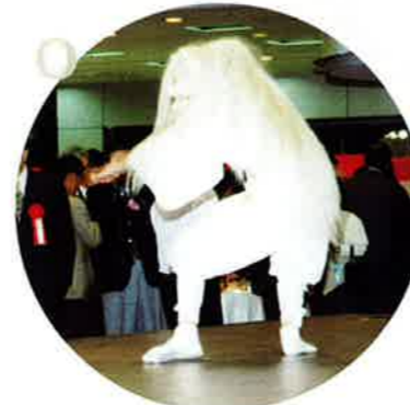
府中ばやしによる「白狐」の舞踊