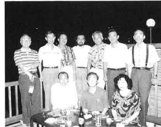
96.8.17 京滋支部懇親会 於 京都鴨川「京町」